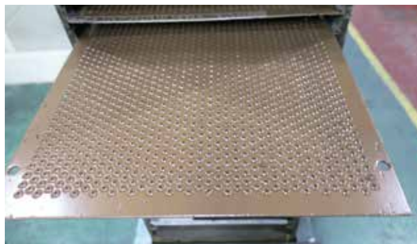
塗装されたネジ製品

動のコンベアーとの組み合わせで自動剥離できることがポイントである。操作は、レーザーの照射ガンを横方向に乗せレーザーを照射する。剥離時には煙が出るが、照射部分に給気装置を設け、剥離の煙が工場内に広がらないように工夫している。