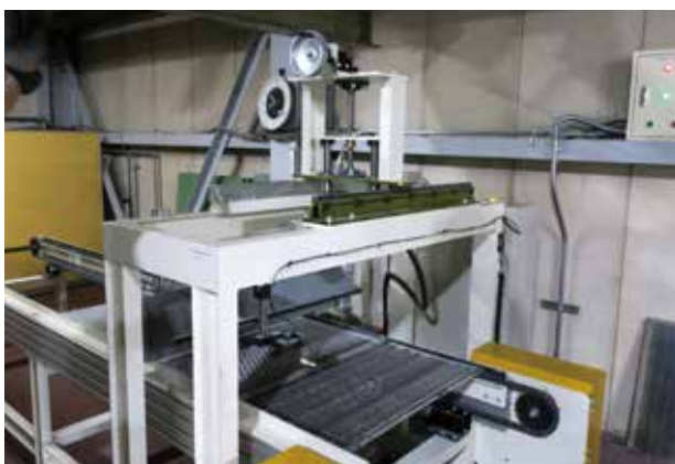
ベルトコンベアー式レーザー剥離装置

昨年11月からネジの治具に付着した塗膜を剥離する「レーザー剥離装置」を導入した。剥離機は、光響のカスタムタイプ100Wレーザークリーナーを採用。特長はあらゆる汚れを除去する、レーザーの焦点距離が可変、母材を傷つけない、ソフトとハードでカスタムが可能。用途はサビ、ペイント、塗装膜の除去、傷みやすい素材の汚れの除去などとなる。