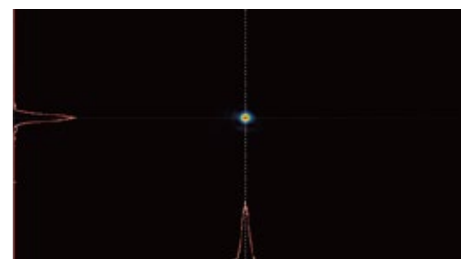
収差補正後プロファイル